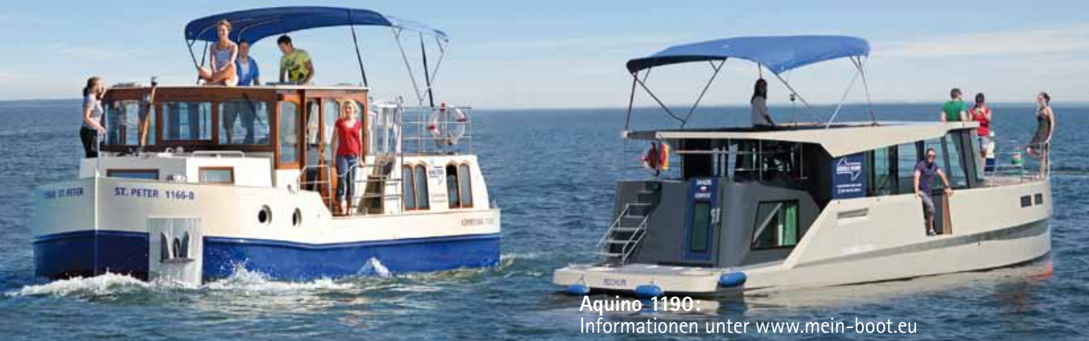
Aquino 1190: Informationen unter www.mein-boot.eu